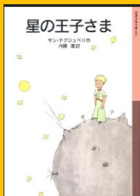
『星の王子さま』 サン＝テグジュペリ／作 岩波書店