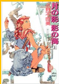
『十二国記シリーズ』 小野 不由美／著 講談社